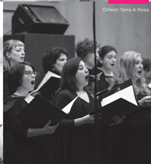
Orfeón Terra A Nosa